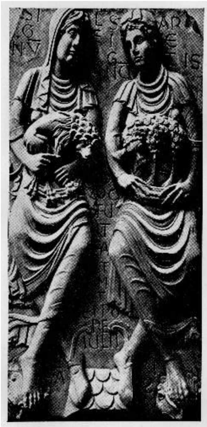
Bas-relief en marbre, autrefois à l'extérieur de Saint-Sernin et maintenant relégué au musée de Toulouse. [Pièce n° 502] Epoque romane XIIe siècle.